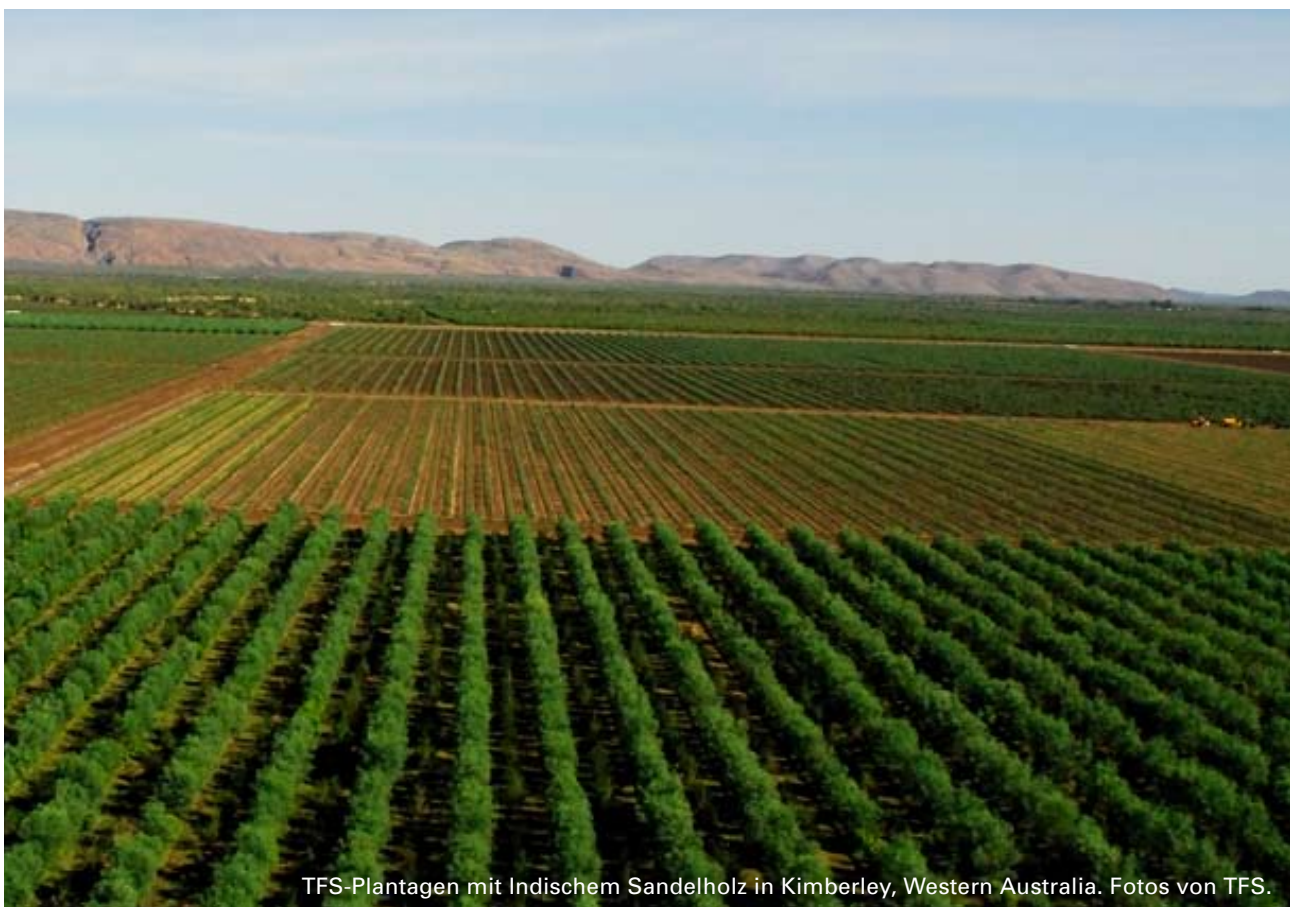
TFS-Plantagen mit Indischem Sandelholz in Kimberley, Western Australia.

Die beteiligten Partner sind sich der genannten Risiken bewusst und haben Vorkehrungen getroffen, Lösungen erarbeitet oder Versicherungen abgeschlossen, um diese Risiken zu handhaben. Weitere Informationen hierzu finden sich ebenfalls im Private Placement Memorandum.