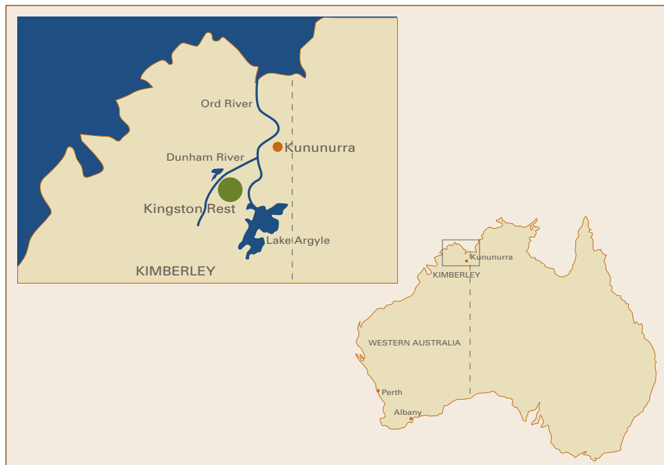
Karte: Kimberley, Western Australia

Die Erfolge der staatlichen Versuchsplantagen in den vergangenen 25 Jahren belegen, dass diese Region ideal zur Kultivierung von Indischem Sandelholz geeignet ist.